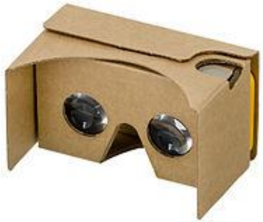
Най-евтиният и достъпен шлем Google Cardboard

HTC Vive шлем за виртуална реалност, разработен в копродукция между HTC и Valve Corporation